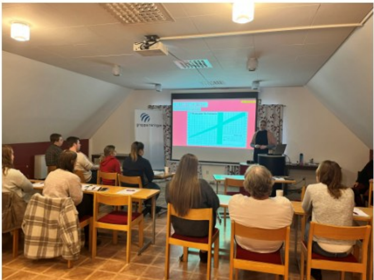
17 december: Flera av våra rådgivare höll föredrag under kursen Den hållbara mjölkkon (2/2) med fokus på förstakalvaren