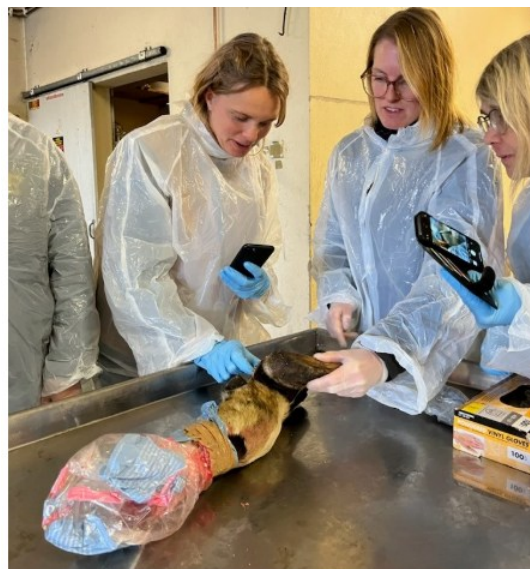
Bild från förra klövkursen, där kursdeltagarna fick känna och klämma på klövar som en del av det praktiska momentet

🌐 Via hemsidan under fliken " Anmälan kurs "