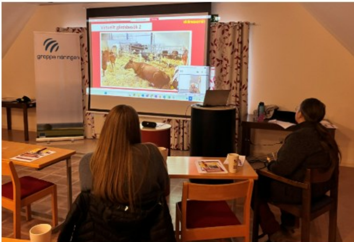
10 december: Virtuellt gårdsbesök introducerades under kursen Den hållbara mjölkkon (1/2) med fokus på kokomfort