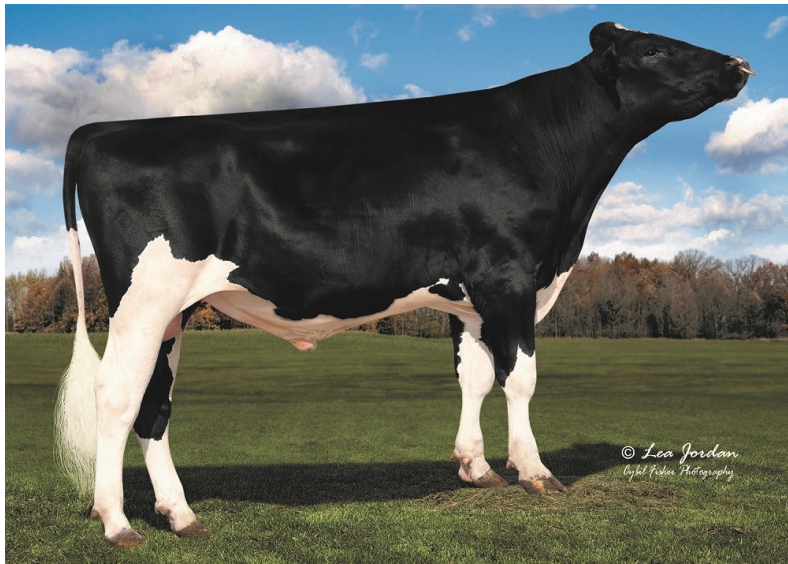
Tjuren på foto beter Drastic-P och är fader till nya tjuren Banks-PP.

En ny polled tjur från WWS där 100% av avkommorna kommer vara polled. Är efter Drastic-P som far och Zipit-P morfar. Mjölk över medel och höjer fetthalten. Positiv juverhåla med framför allt låga celler. Breda och sluttande kors, bra ben och mycket bra grunda juver med bra anföring. Dessutom snabbmjölkade och med optimal spenplacering.