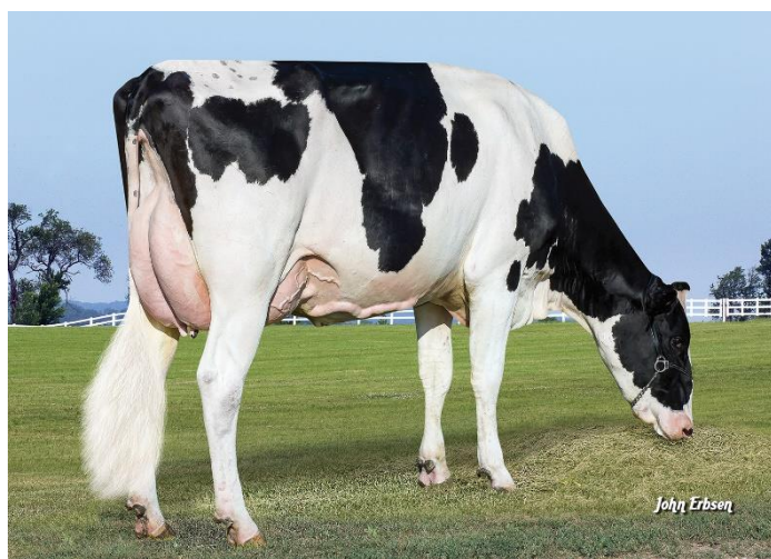
Dotter till Azor

Bör skyddas på juverhälsa, spenplacering och ben bakifrån. Finns även som könsorterad för endast 295:-