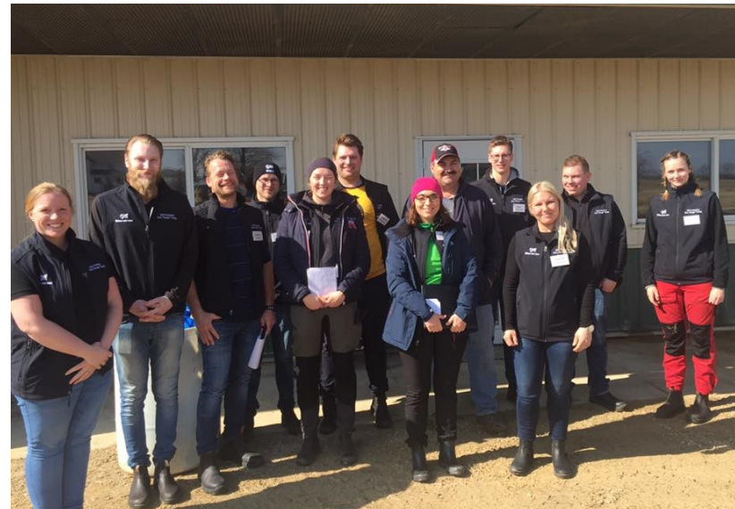
Framtidsgruppen i Wisconsin, USA