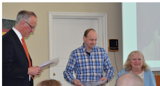
Ängagårdens Lantbruk AB