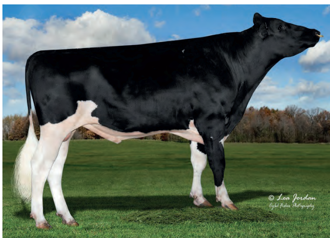
FYI- en Frazzled son

Våra riktlinjer som är baserade på det vi ser och hör på gårdarna har gjort att vi valt en viss typ av tjurar. Deras profil är; produktion med bra halter, balanserade, hälsa och bra juver. Mycket tyngd ligger även på bra ben (inte för raka och mer parallell ställning), undvika egenskaper som avviker för mycket. Styrkan är, vårt fokus på egenskaper och den välfungerande kon som är ekonomisk. Hon ska passa in i stallmiljön och fungera vid mjölkning.