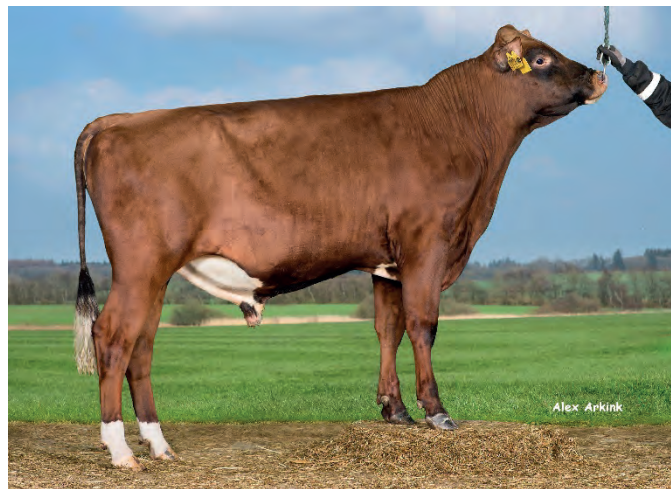
VR Vilperi en av de SRB tjurarna vi har hemma.

Vario är en av de nya SRB tjurarna vi valt att ta hem, mycket mjölk och bra hälsoegenskaper gör att han passar många önskemål. Mycket trevliga kroppar, samt bra ben och juver.