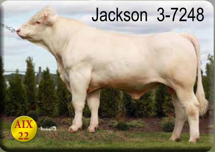
Uppfödare: Askome Charolais NP, Harplinge