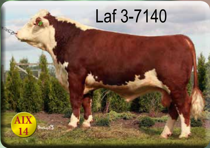
Uppfödare: Stendala Hereford, Simrishamn