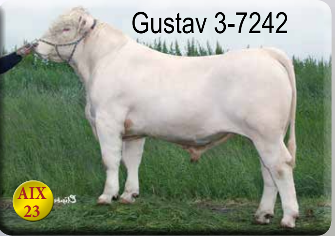
Uppfödare: Oscar Dieden, Skalltorps Säteri