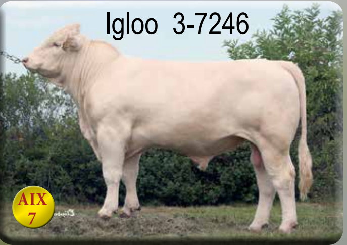
Uppfödare: Askome Charolais NP, Harplinge