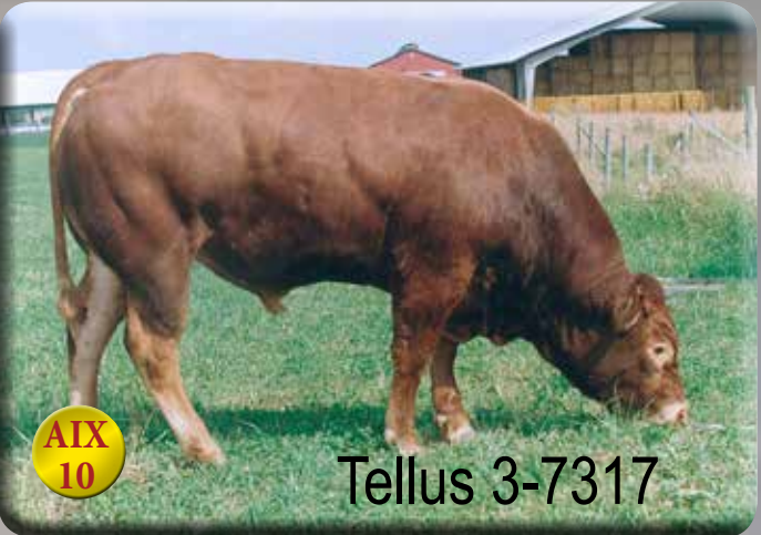
Uppfödare: Ryfors Bruk Nedre, Mullsjö