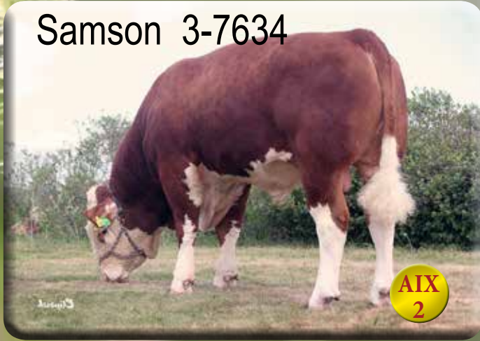
Uppfödare: Joacim Petersson, Lückeby