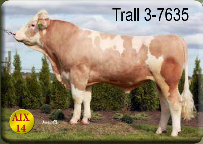
Uppfödare: Allan Ekstrand, Landsbro