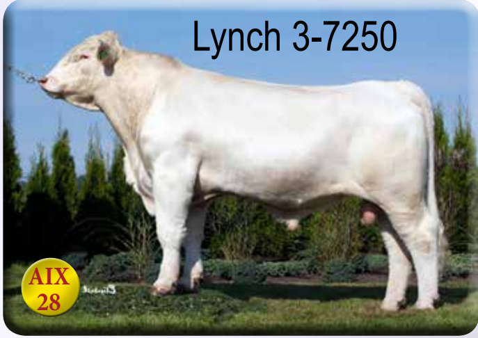
Uppfödare: Sven-Olof Hägg, Sonarps gård