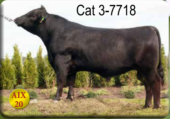
Uppfödare: Arne Gustavsson