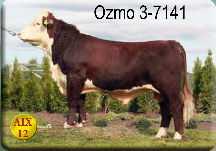
Uppfödare: Olle Larsson, Skövde