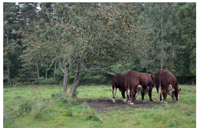
Tre herrar som ställde upp sig, när bilder togs på Folkestorp. Önskar en härlig höst!

VH Markos P- En tjur som kan användas på kvigor, söker ni en tjur med bra klövhälsa, då är han ett bra alternativ!