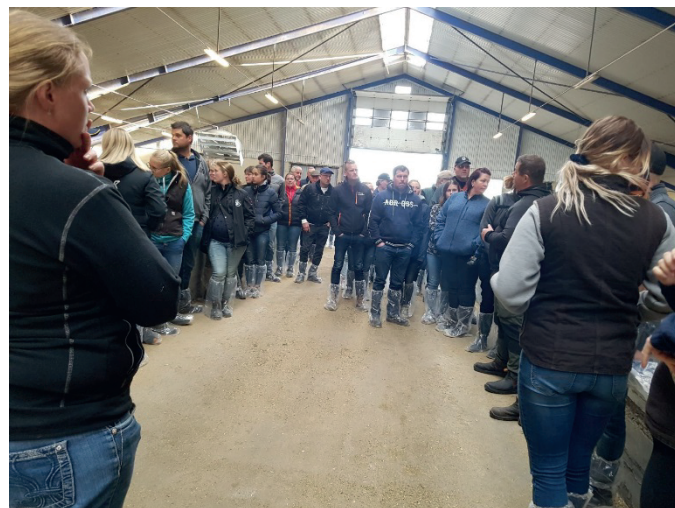
Grupp på gårdsbesök hos Rosdala HB

En sak som diskuterades en del under grillningen var personal, hur man motiverar och arbetar tillsammans i driften för att skapa rutiner och få till en strukturerad arbetsdag. Många som medverkade på besöket tog med sina anställda tummen upp för detta, ett fantastiskt sätt att inspirera och få fler på gården att tänka i andra banor.