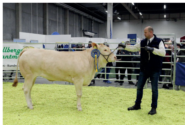
Best In Show Mila 2019 Blonde d'Aquitaine kvigan 369 Hadassa av Flansbacka