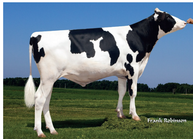
Goddard ny kvigtjur på väg in.

GODDARD (Blowtorch x Delta x Supersire) En extremt lättanvänd tjur som uppfyller de flesta kraven som ställs. Produktion, fertilitet, hälsa, välbalanserad och dessutom kvigtjur. Han ger medelstora djur med längre spenar. Listan är lång över hans goda egenskaper, pris 230 kr