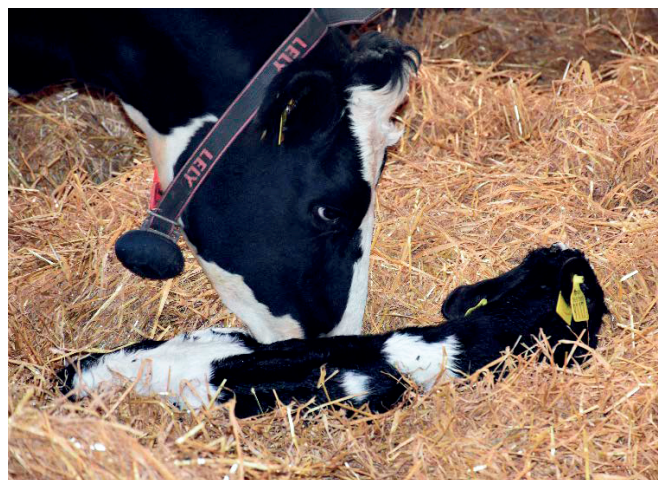
Välstrött gör att kalvarna håller värmen