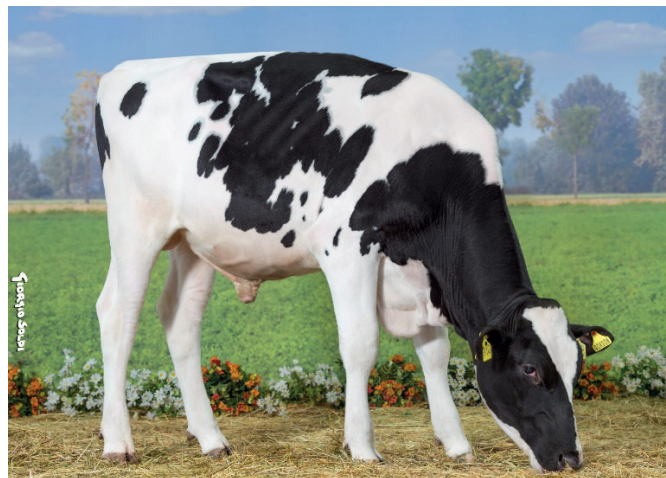
Gordon en av våra nya italienska tjurar

Tjurarnas siffror uppdaterades nyligen och det gör att vi väljer att plocka in nytt som uppfyller de krav vi ställer. På vår lagerlista kan ni se vad som är nytt och hemma från Viking, tjurar från World Wide Sires tar ett litet tag innan de är på plats. Diskutera med er avelsrådgivare eller hör av er vid intresse om ni är intresserade av använda er av det bästa på marknaden.