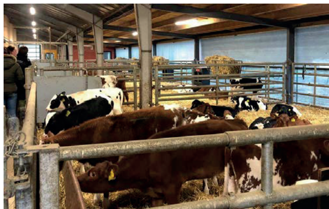
En del av kalvstallet på Wanås Gods