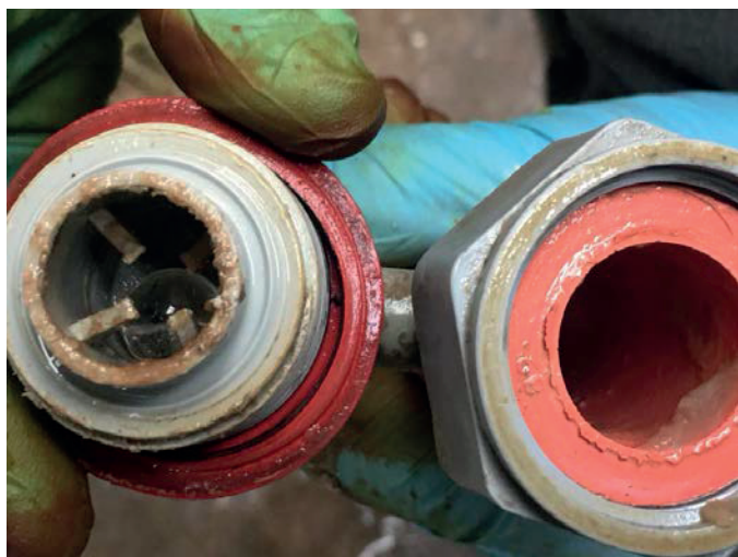
Nappar- Hur det kan se ut när man plockar isär en napphink.

Åter igen kommer utfodringsdiskussionen av kalvar upp och de som gjort en ändring har även sett en positiv skillnad. Minskat på det långa grovfodret hos småkalvarna och ökat givorna av både mjölk och kalvmüsli, gör att våmmen får en bättre start. För mer information om detta hör gärna av er eller kolla vår Facebook sida.