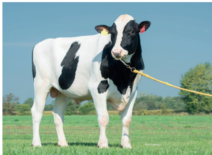
Magictouch när det är fertilitet som gäller.

Magictouch (Modesty x Balisto)- Extremt bra egen- och dotterfertilitet. 250 kr