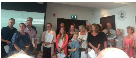
Pristagare med 100-tonnare från Holstein Stämman

En trevlig stämma med många deltagare från hela vårt långa land och med samma gemensamma intresse för Holsteinrasen. Stort grattis till alla de som fick pris för sina 100-tonnare och övriga hederspriser, alltid lika roligt att se när det stora arbetet ni gör faktiskt lönar sig och ger en liten guldkant i vardagen.