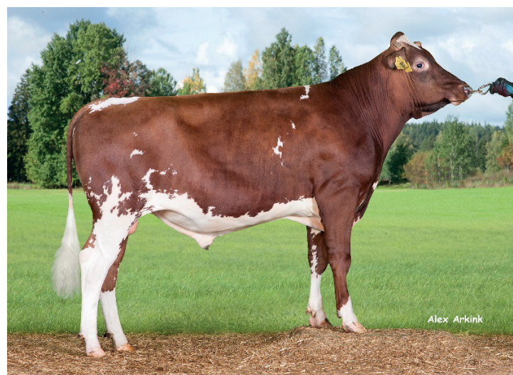
Tjur 22-7820 VR Toffee. Han ger både bra exteriör och mycket mjölk.

Antal doser: 25-49 doser 5% från 50 doser 10%