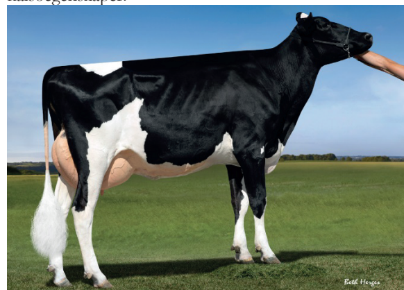
Moder till Curry

Det kompletta alternativet, se till er besättning vilket är ett behov för att göra mål, vi har nu tre tjuvar hemma som vi anser ska kunna hjälpa er dit. Produktion, bra exteriör och goda hälsoegenskaper.