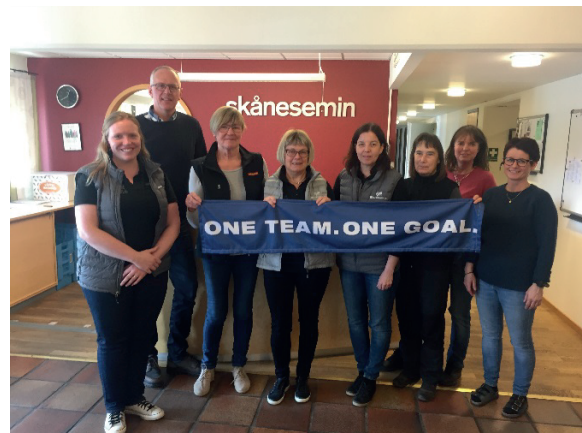
Ett lag samma mål