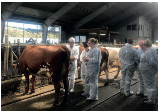
Bild från då vi bedömde i grupper

De nordiska länderna träffas var 3:e år och diskuterar exteriörbedömning, eftersom vi använder samma program i både Sverige, Danmark och Finland. Norge har varit med vid ett par tillfällen och har nu börjat att använda samma program. I år var det Norges tur att stå för denna träff och de passade även på att visa norsk röd boskap.