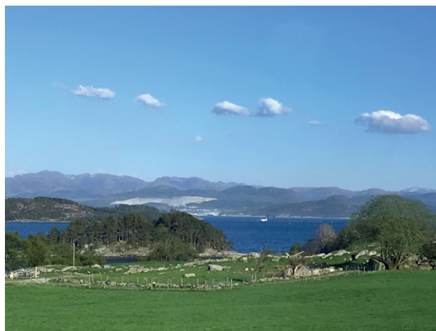
Norge och dess fantastiska landskap

Första dagen var vi inne och tittade på statistik hur det ser ut mellan länderna, vi ska ju försöka vara så lika som möjligt. Dag 2 var vi ute på gårdsbesök och jobbade i grupper blandade från de olika länderna och bedömde kor som sedan gicks igenom. På kvällen åkte vi en båttur i solnedgången, fantastiskt vackert. Sista dagen sammanfattades synpunkter från de olika grupperna, om det var något vi ville ta upp, då vi ibland tycker och ser till olika egenskaper vid bedömningen.