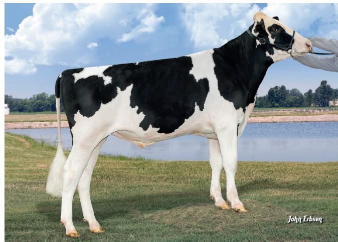
Melarry Josuper Frazzled ET

9-7643 Lambrecht SSHot AXEL (Supershot – Jackman – Bookem)