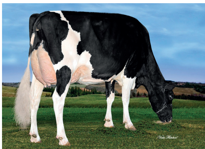
Brewmaster dotter, Jeanlu Brewmaster Glad

Använd könssorterat vid första insemineringen, BREWMASTER är en tjur i klass för sig, som erbjuder det många vill ha, produktion med toppenhalter och bra ben och juver. MILITO är en lättanvänd tjur med balans rakt igenom och en annorlunda härstamning. Om ni väljer en tjur som inte är könssorterad då är följande tjurar värda att titta på → CRABTREE ; mycket mjölk och högt överlevande tal. CEDARWOOD ger produktion med bra halter.