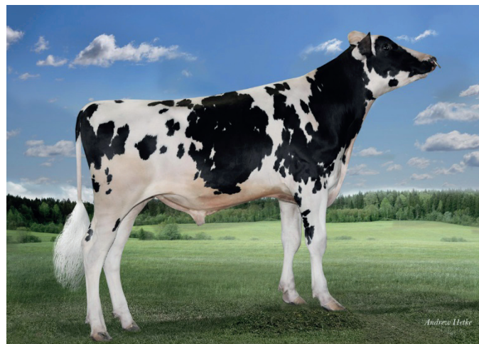
Lambrect Sshot Axel ET

Min 118, Juverhälsa 108, Dotterfertilitet 113, NTM +29G Pris 190: -