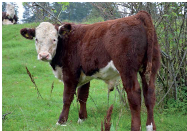
Tjurkalv från Folkestorp

Du vet väl att du kan hitta dina foderanalyser på www.vxa.se under "Mina sidor" där du sedan väljer "Fo – Foderanalyser".