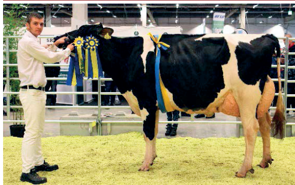
2751 Travmilada Grand och Supreme