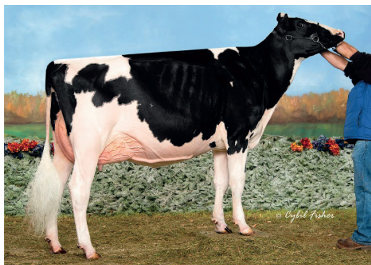
Gold Chip dotter

USA Typ 2,47, Juver 2,48, Ben 2,24 6761 dtr. Kanada Conformation +17, Juver +15, Ben +15 556 dtr. Pris 275 kr